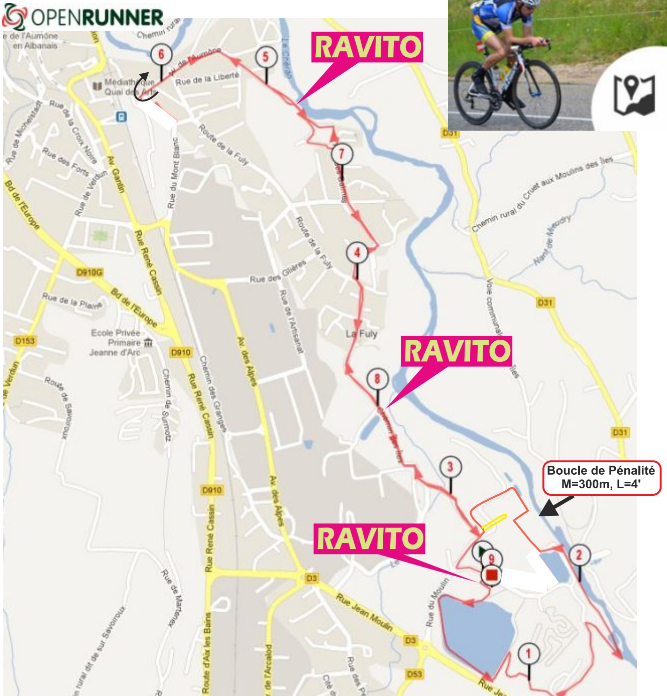
[ Triathlon de Rumilly Course à Pieds ]